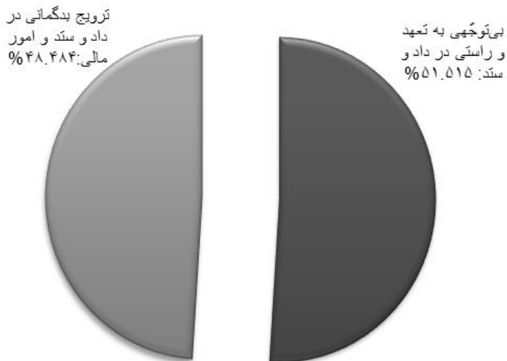
نمودار شماره‌ی سه - بسامد مفاهیم ناسالم پیرامون دادوستد

در نمودار دایره‌ای زیر می‌توانید بسامد مفاهیم ناسالم با موضوع دادوستد را مشاهده کنید.